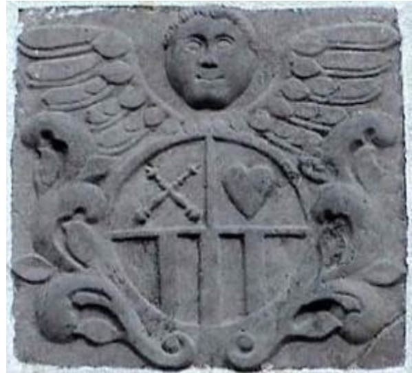
Fig. 58 Ornament boven de hoofdingang met het wapen van de proost