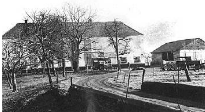
Fig. 57 Keyserbosch rond 1960

Met vele anderen werd 'de Proefst van Nerre', zoals de Brabants geschiedschrijver Jan van Heelu hem in de 13e eeuw noemde, 'met eere gevaen' (=gevangen genomen).