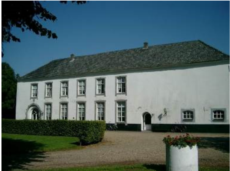
Fig. 54 Klooster Keyserbosch

Klooster Keyserbosch bleef wel onder bestuur van de abdij en onder leiding van de abt van Averbode staan, maar in Neer had een hoge geestelijke namens de abt de leiding. Die geestelijke werd 'proost' genoemd.