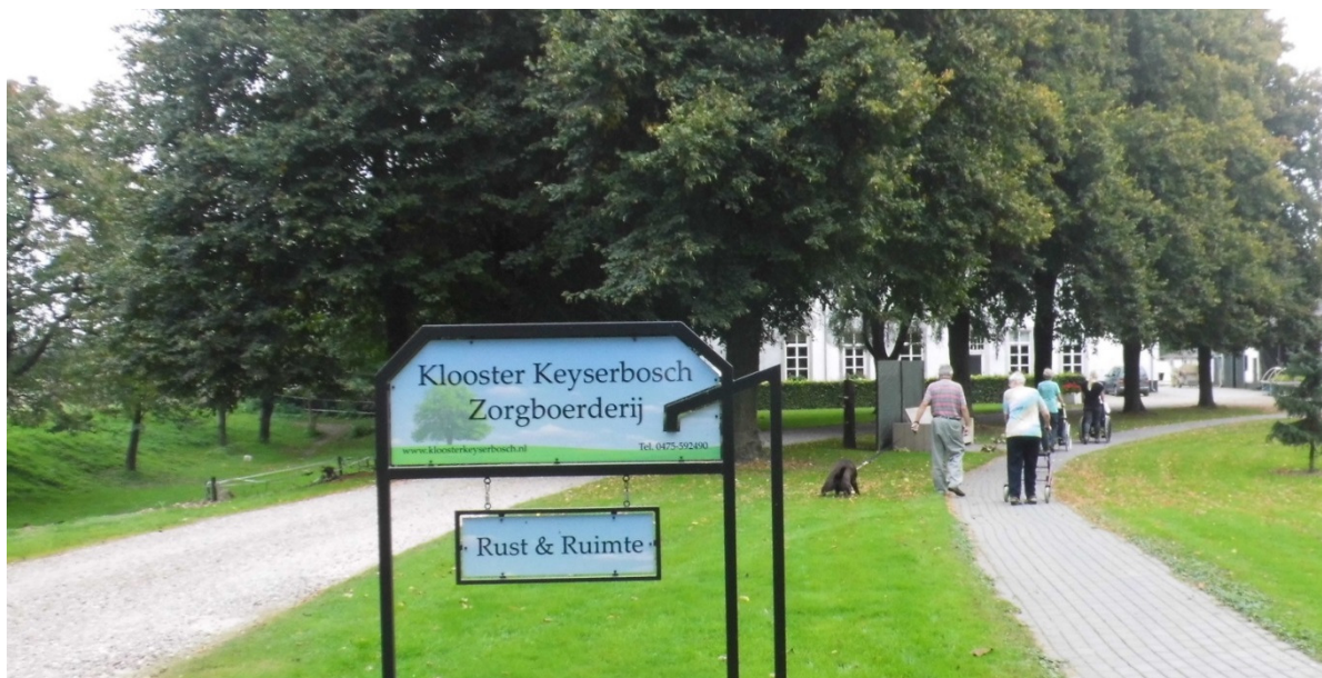
Fig. 59 Klooster Keyserbosch, nu als zorgboerderij