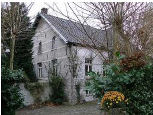
Fig. 43 De Friessemolen

In Neer waren in de late Middeleeuwen liefst zeven molens. Op de Kwirbeek was er een en op de Neerbeek waren er vijf, omdat de beek voldoende watervoering kende. Op de Wijnbeek stond de Sniemolen.