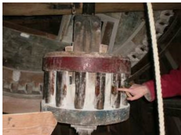
Fig. 50 Aandrijving

De molen werd op 1 oktober voor vier jaar verpacht en de molenaar moest daarvoor jaarlijks in twee termijnen koren bezorgen op het kasteel te Neer. Rond 1500 was dat 31 malder, in de zeventiende eeuw oplopend naar 36 malder en later 40 malder rogge per jaar. Een malder was voor de molenaar en de Meijelse boer van vroeger waarschijnlijk een duidelijke hoeveelheid. Maar een malder is niet eenvoudig in kilo's of liters uit te drukken, het was dan weer de hoeveelheid koren die een