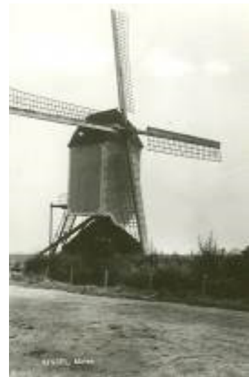
Fig. 46 De oude standaardmolen

Aan het eind van de Middeleeuwen, in de 13 de en 14 de eeuw, werden de watermolens steeds meer vervangen door molens die door windkracht werden aangedreven. Deze nieuwe vinding brachten de Kruisvaarders mee uit het Midden-Oosten. Er was echter één groot verschil: bij de windmolen uit het Oosten kon men de wieken niet 'op de wind zetten', maar stonden deze altijd naar één kant, daar waar meestal de wind vandaan kwam.