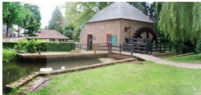
Fig. 42 De watermolen bij de Sprunk

Helden had in 1470 een windmolen met molendwang, de standaardmolen op de Driessen. Deze is rond 1935 afgebroken.