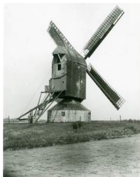
Fig. 52 De Anthoniusmolen voor de restauratie

Hij kreeg toestemming voor de bouw van een windmolen. Daarop richtte hij op de Molenberg, een verhoging aan de Schijfweg ter hoogte van het Molenkappelletje, een nieuwe windmolen.