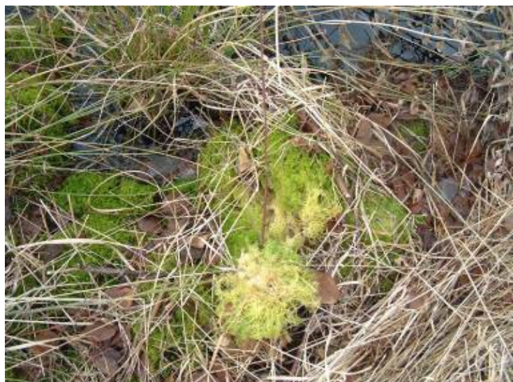
Fig. 71 Uit spagnum of veenmos en andere planten ontstaat turf

Je ontdekt er hoe de turf ontstond in het grote, kale maar ook boeiende veengebied.