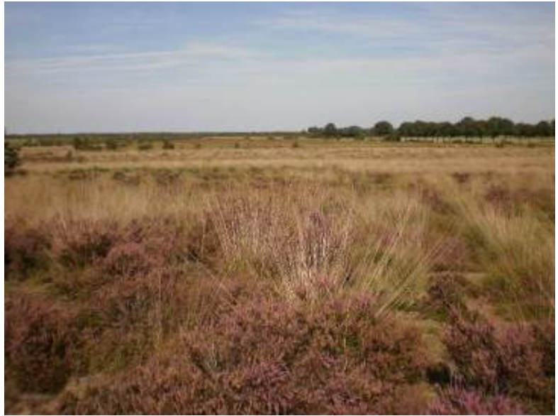
Fig. 72 Gezicht vanaf Amsloberg

Je ziet ze er niet meer, de landsheren van Ghoor die op Amsloberg aan het jagen waren op klein wild in hun eigen jachtgebied, dat 'warande' werd genoemd. Daar mochten de andere inwoners niet komen en al zeker niet jagen op konijnen, korhoenders en andere dieren.