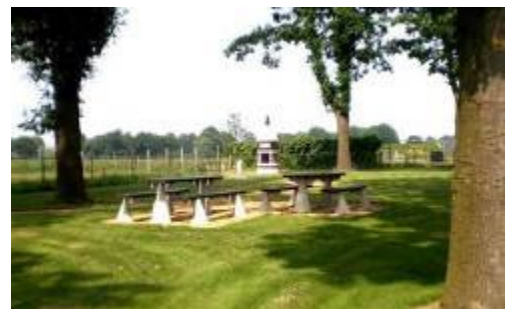
Fig. 19 De Willibrordusput op de grens van Brabant en Limburg

Misschien vond zelfs Sint Willibrordus hier rust en water om te drinken en te dopen.