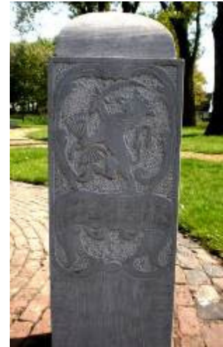
Fig. 17 De leeuw met zeven pijlen (Nederlanden)

De steen uit 1549 lag al lang in brokken onder de grond, toen op 12 mei 1761 de huidige grenssteen werd geplaatst. Die heeft aan een zijde het wapen van de Seven Geünieerde Provinciën ofwel de Verenigde Nederlanden, waar onder meer Deurne en Asten toe behoorden: de leeuw met de zeven pijlen. Aan de andere zijde staat het wapen van Oostenrijk, omdat Meijel en Nederweert vanaf 1715 tot Oostenrijks Gelder behoorden: de tweekoppige adelaar.