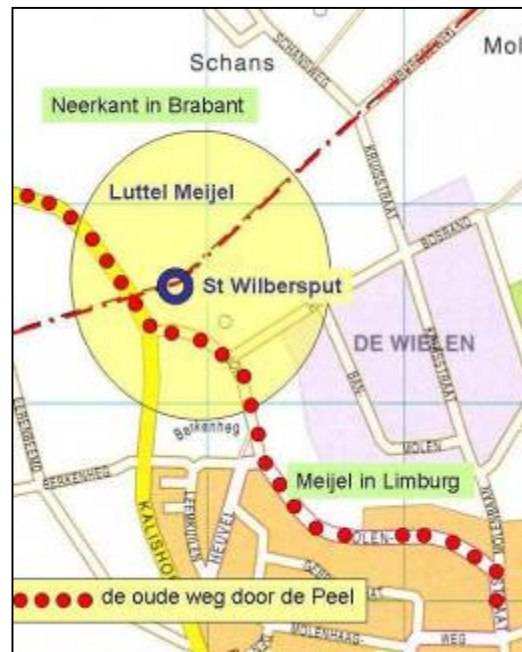
Fig. 15 De oude weg door de Peel

Over die weg zou de heilige Willibrordus getrokken zijn van Utrecht via zijn bezittingen in Bakel en Deurne op weg naar zijn klooster in Echternach. Aan die oude weg bezat het klooster van Echternach enige boerderijen o.a. in Liessel en op de Heitrac (Neerkant).