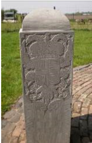
Fig. 16 De tweekoppige adelaar (Oostenrijk)

Het was slechts een richtpunt om een rechte lijn als grens te kunnen trekken tussen de ruziënde gemeenten Someren en Nederweert. De gemeenten Deurne, Asten en Meijel die bij de St. Willibrordusput aan elkaar grensden, waren in 1549 niet eens bij de plaatsing van deze steen betrokken.